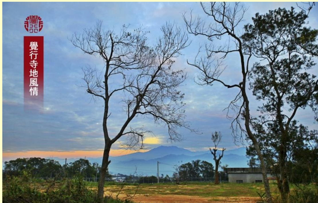
2016年2月10日寺地舉辦新春萬燈供佛點燈祈福法會，於下午17時50分天際由藍、紅色所交織成的美麗夕陽輝映景色，令人目不暇給。

透過共事的磨合，讓我學習不再以自我為標準，不執著自己偏好的角色，因為每一個環節皆是關鍵，並學習以恭敬心認真完成眼前的事，隨緣盡分，不再於自他、高下，妄生分別，然在共事的每一個當下、起心動念、境界的考驗，無非都是在提醒我們，要清楚明白地在習氣上改進、修正。最重要的在這段期間亦才體會到發菩提心必須付諸於實踐，而不是空口理論。(宥維)