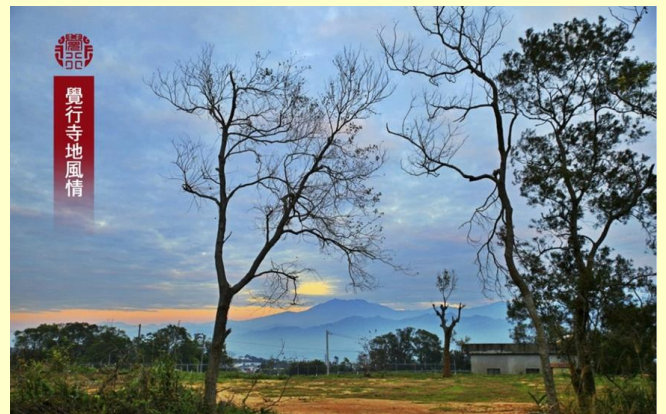
2016年2月10日寺地舉辦新春萬燈供佛點燈祈福法會，於下午17時50分天際由藍、紅色所交織成的美麗夕陽輝映景色，令人目不暇給。